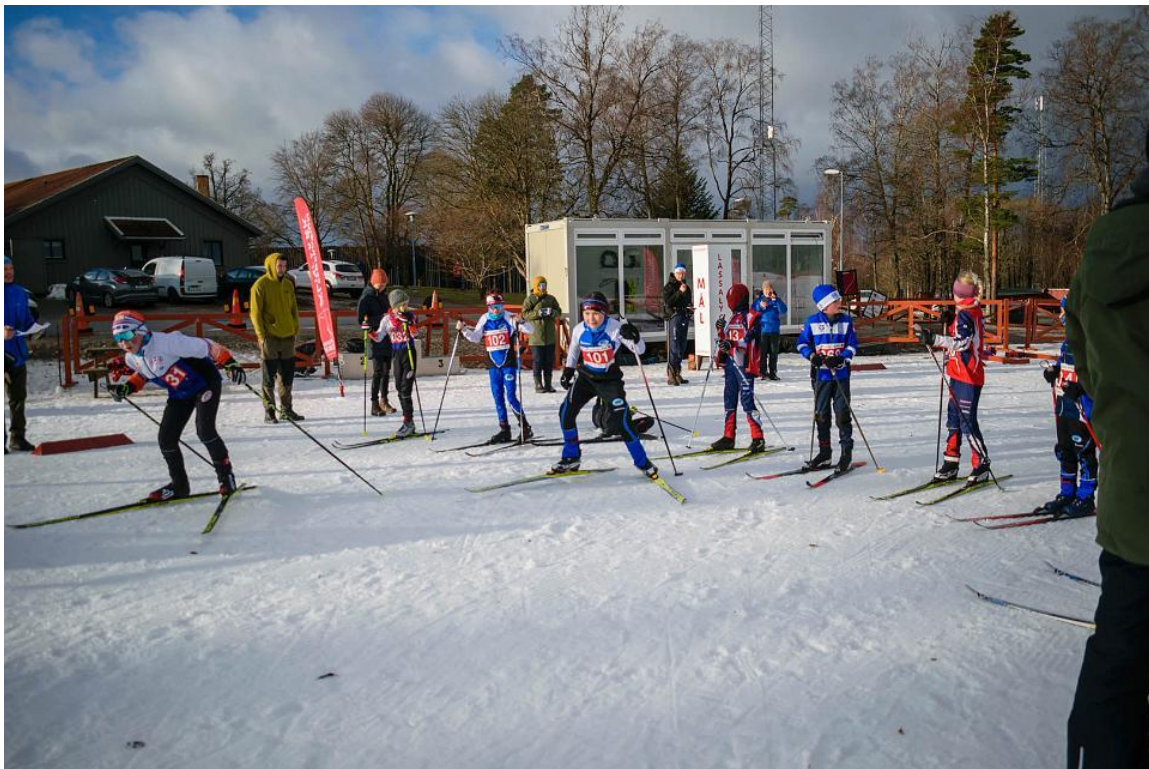
Situation fra sprint stafet 2024.