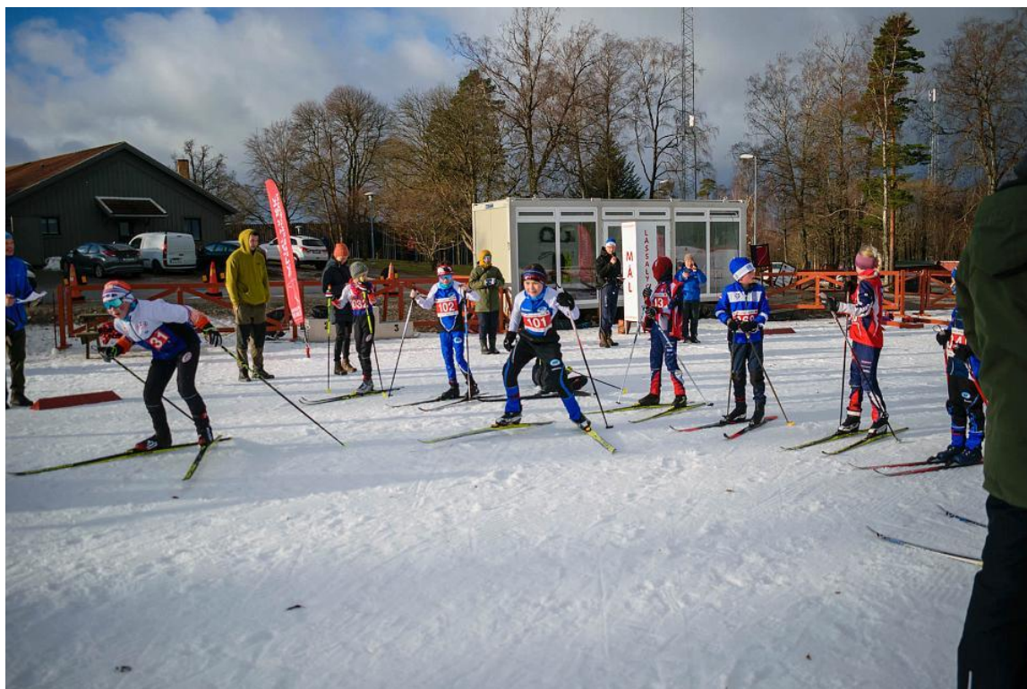
Situation fra sprint stafet 2024.